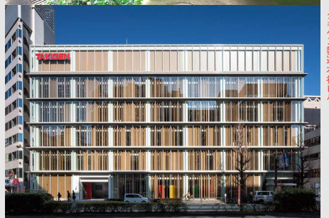
タキゲン製造本社ビル