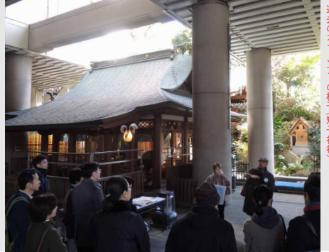
過去のガイドツアーの様子(雉子神社)