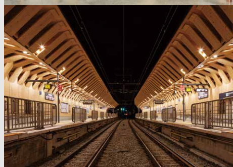
東急池上線戸越銀座駅