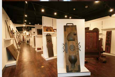
昭和ネオン高村看板ミュージアム